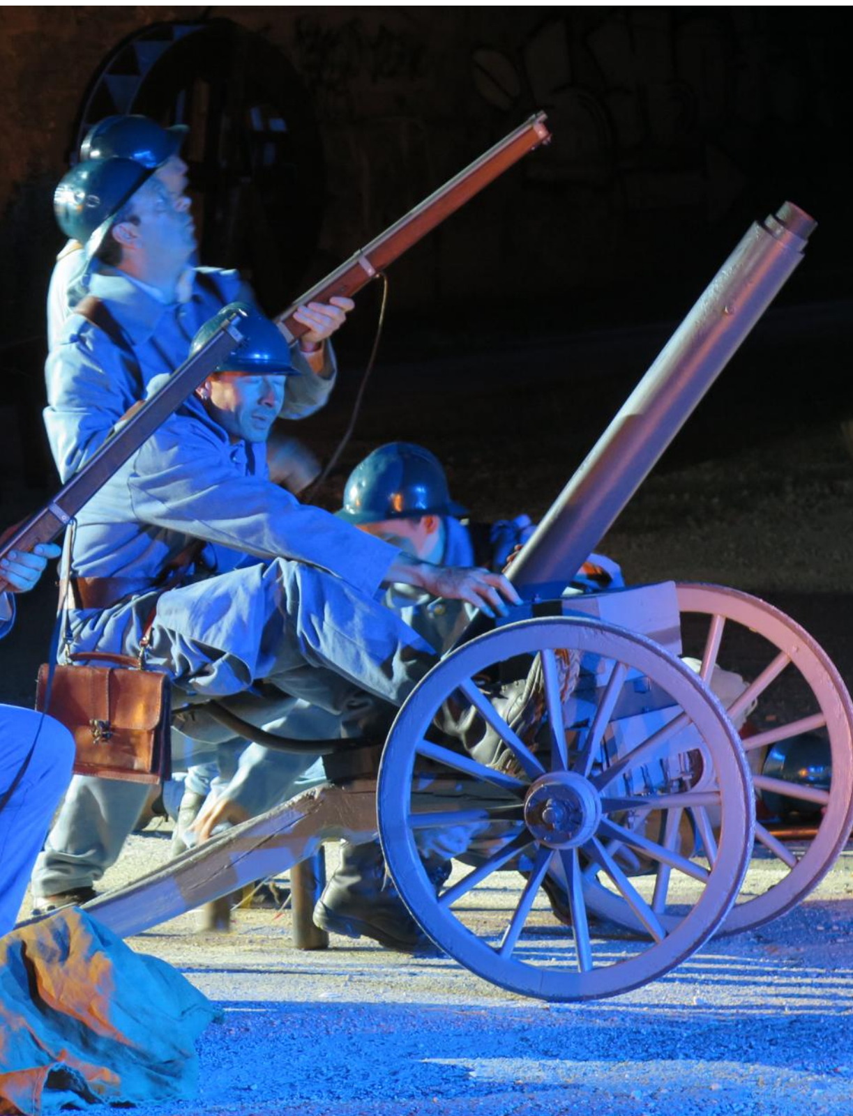
Le son et lumière de Brebotte retrouve l'évocation de la Première Guerre mondiale en mettant particulièrement à l'honneur une grande figure locale du conflit.