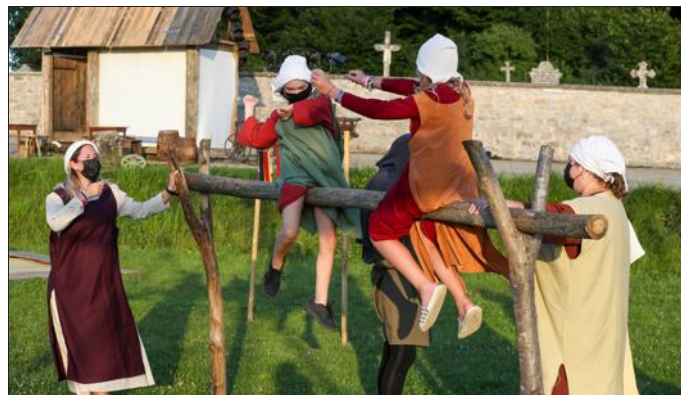
"La fille cachée du chevalier Richard" : journées médiévales de Brebotte du 22 au 24 juillet.